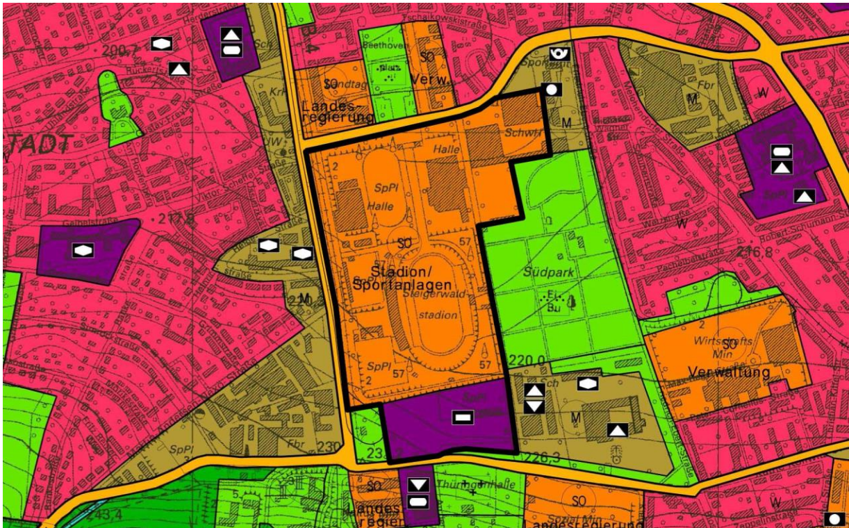
Auszug aus dem wirksamen Flächennutzungsplan (Veröffentlichung im Amtsblatt vom 27.05.2006)