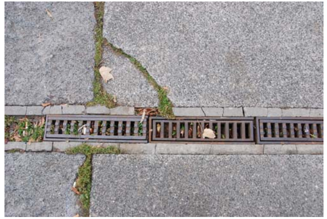
unterschiedliche Abdeckungen der Kastenrinne