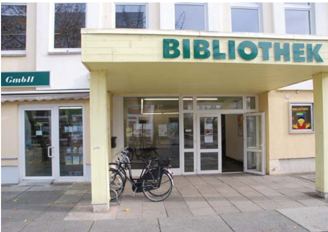
Mehrzweckgebäude mit Bibliothek, Buchhandlung