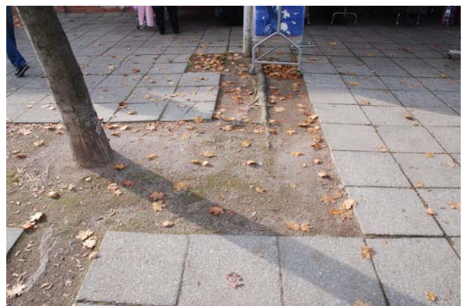
Herausragende Wurzeln im Wegebereich