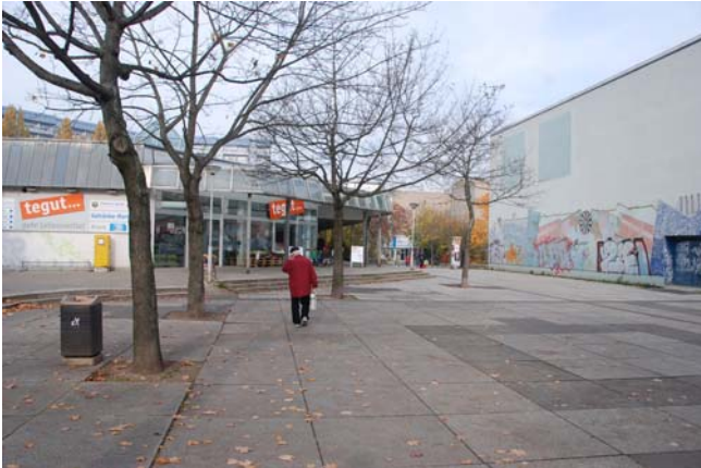
Lebensmittel- und Getränkemarkt gegenüber der Sporthalle