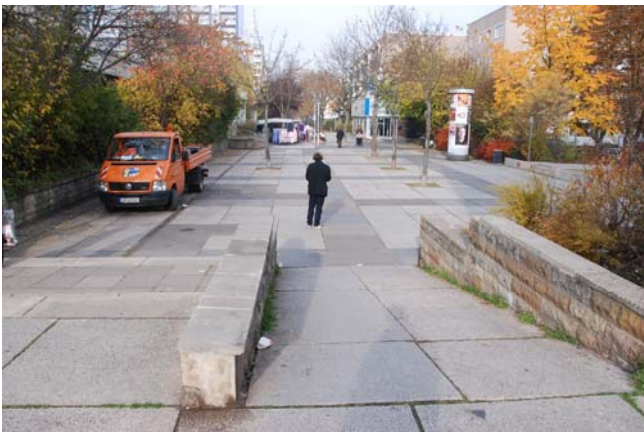
Beispiel für die zahlreichen Rampen- und Stufenanlagen der einzelnen Plateaus