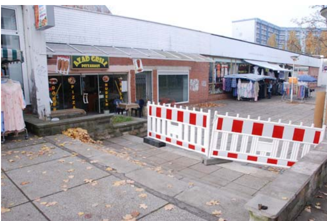
Fußgängerzone mit diversen Schnellrestaurants