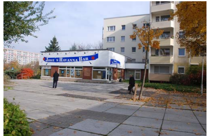
Pavillon im nordwestlichen Teil des Berliner Platz