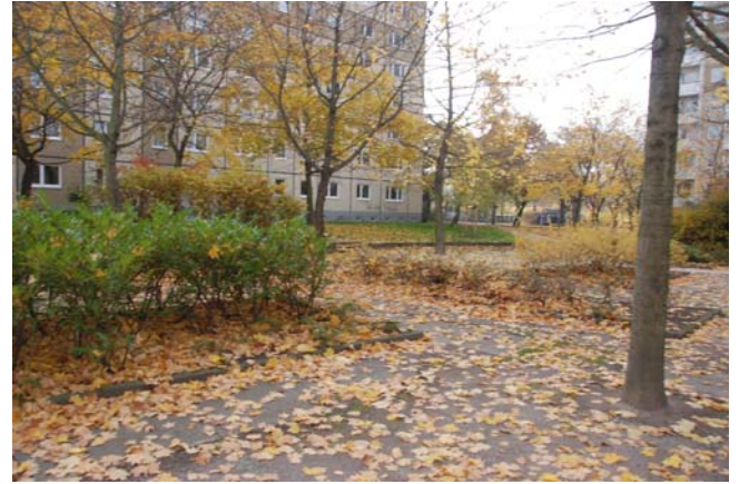
Pflanzflächen und Beete