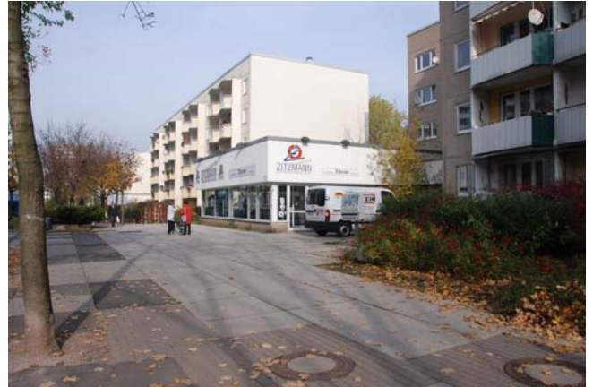
Pavillon mit Lebensmittelfachgeschäft