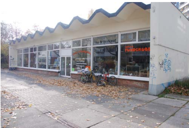
Pavillon Berliner Platz 5