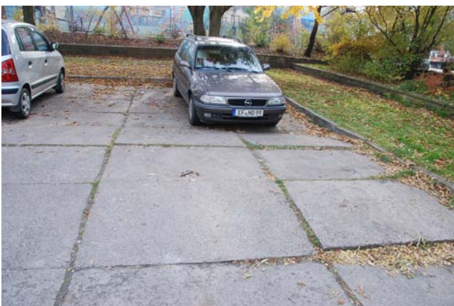
unterirdische Kanalanlage in der Berliner Straße