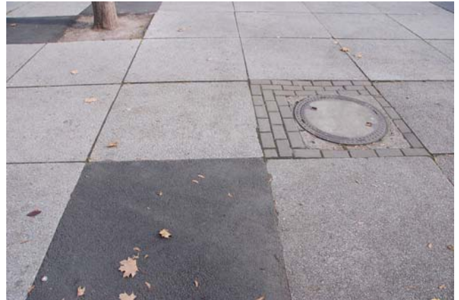
häufig wechselnde Wegebeläge