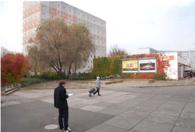
Vorplatz mit Wasserbecken