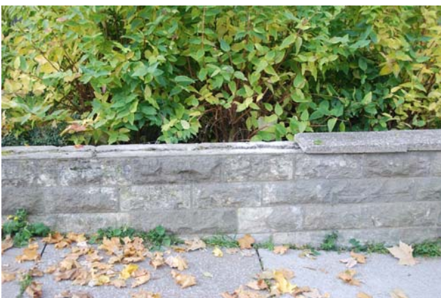
Natursteinmauer ohne Abdeckplatte