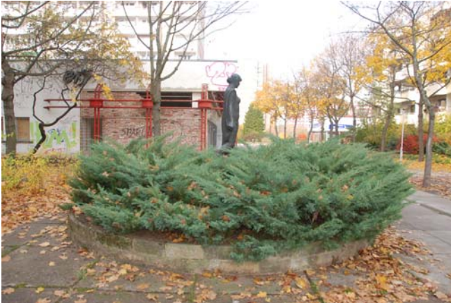
Pflanzflächen mit Bronzeplastik nordwestlich in der Fußgängerzone