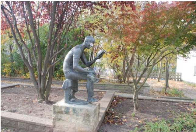
Beispiel für diverse Bronzeplastiken entlang der Fußgängerzone