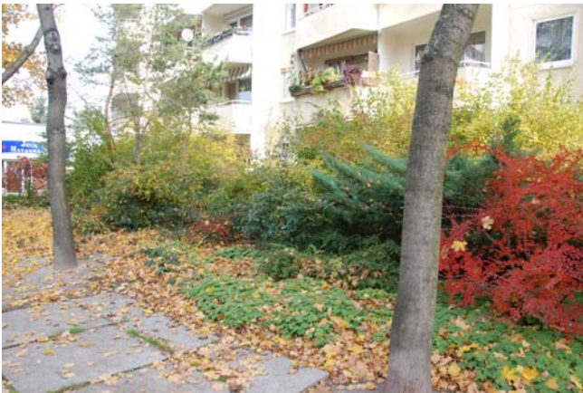
Gestörte Sichtbeziehungen und Lichtmangel durch hohe Strauchbestände