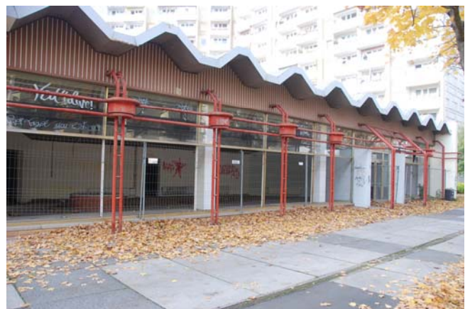
Leerstehender Pavillon am Berliner Platz 7