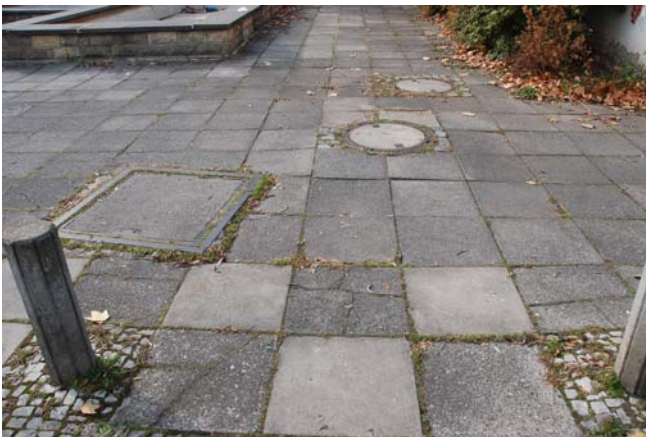
diverse Einstiegs- und Versorgungsschächte