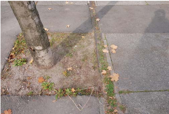
Kastenrinne entlang der Fußgängerzone