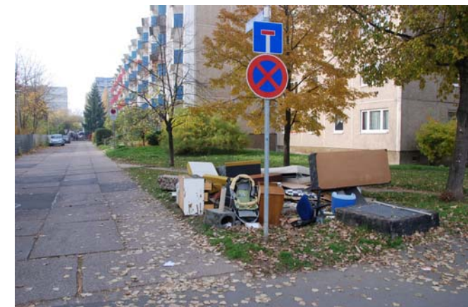
Blick von Osten in die Berliner Straße Richtung Berliner Platz