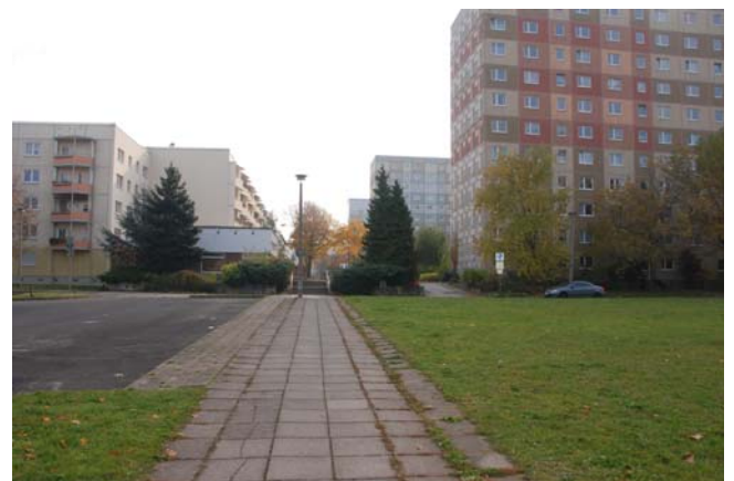
Blick von der Straße der Nationen zur Fußgängerzone des Platzes