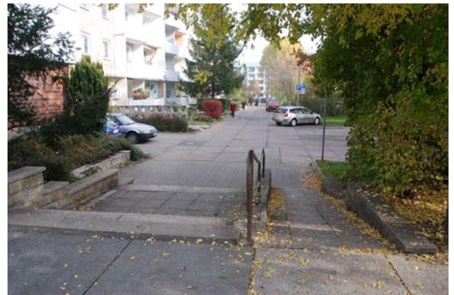
Blick in die Berliner Straße vom Berliner Platz