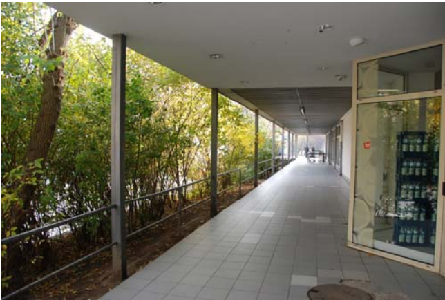
hohe Baum- und Strauchpflanzungen in Sichtbeziehungen