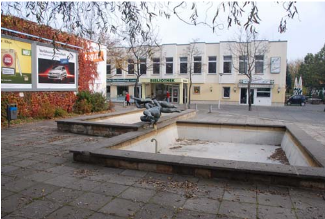
Wasserbecken Ecke Prager Straße und Warschauer Straße