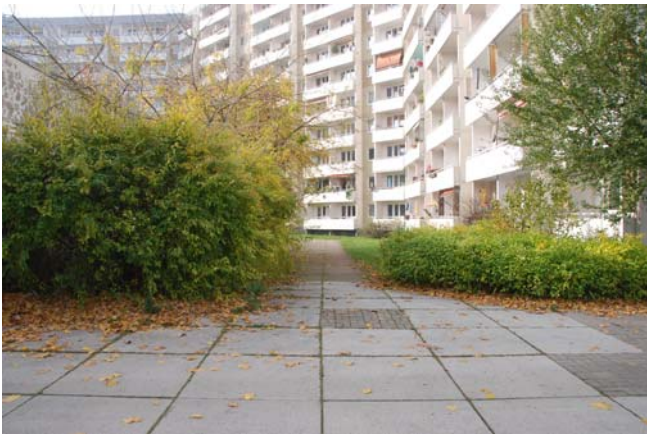
Blick in westliches Wohnquartier