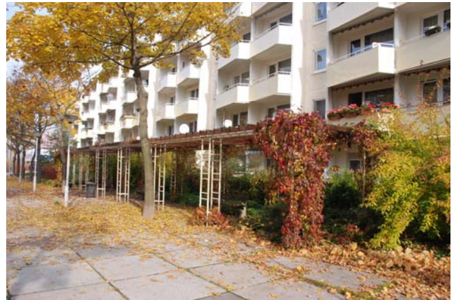
Pergolenanlage entlang der Fußgängerzone