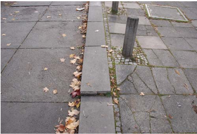
Unfallgefahren durch alte und gebrochene Wegebeläge