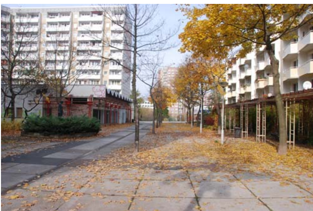
Blick Richtung Nordwest auf leerstehenden Pavillon