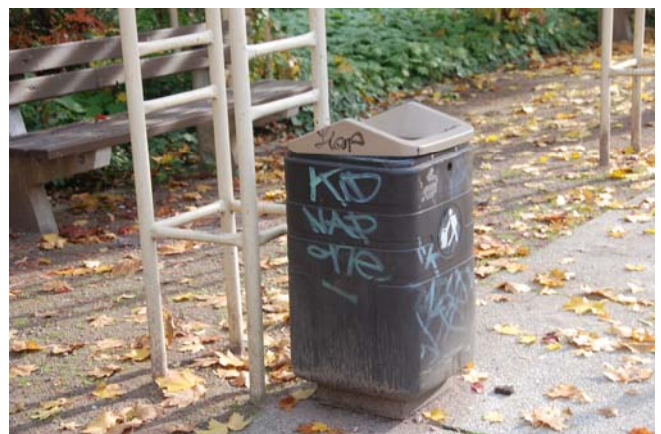
Abfallbehälter an einer Pergola