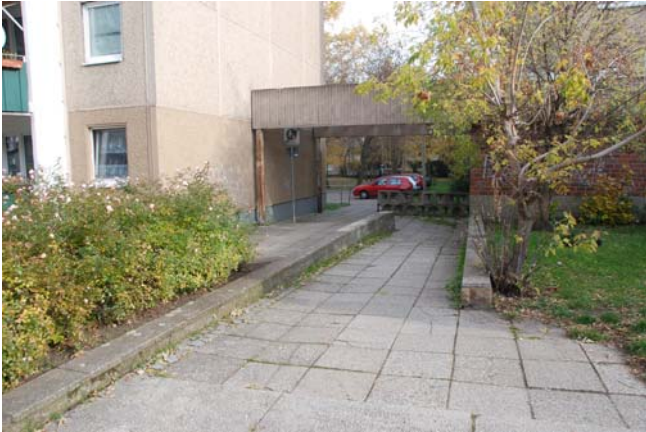
Durchgang zu östlichem Wohnquartier