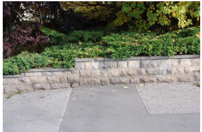
gut erhaltene Stützmaueranlage