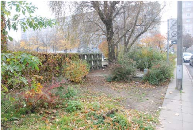
Trampelpfad zum Berliner Platz Ecke Prager Straße und Warschauer Straße