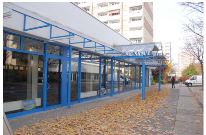
Pavillon Berliner Platz 6