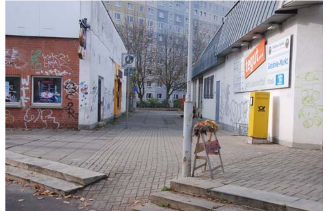
Blick zu Prager Straße in Höhe der Sporthalle