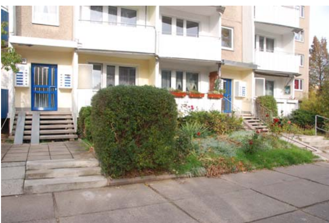
Wohneingänge und Vorgärten der Berliner Straße