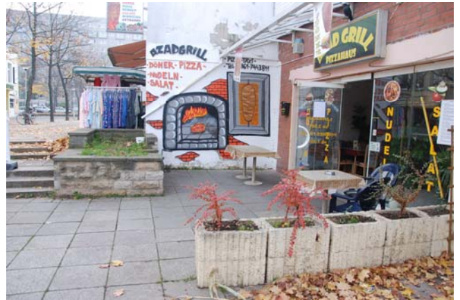
kleinteilige und unattraktive Pflanzenbestände