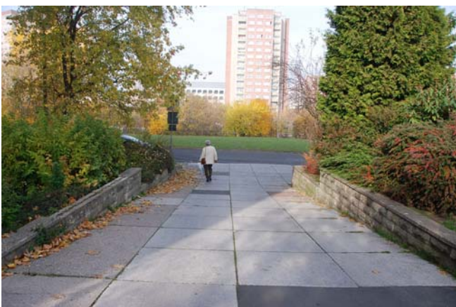
Blick zum Moskauer Platz nördlich der Fußgängerzone