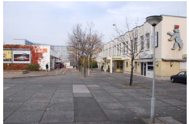
Blick von Warschauer Straße in Fußgängerzone